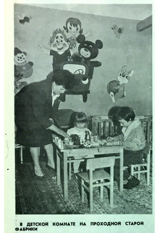
В ДЕТСКОЙ КОМНАТЕ НА ПРОХОДНОЙ СТАРОЙ ФАБРИКИ