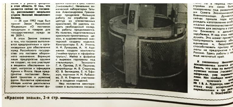
На фотографии вязальная машина делает трикотажную основу телняшек, газета «Красное знамя», 7 сентября 1992, №24 (4383), с. 2.

Проблемы стали остро проявляться в начале 1990-х годов, но предпосылки для них были заложены в советские годы самой экономической системой и местом Красного знамени в ней. Коротко говоря, фабрика была слишком большой и сложной, чтобы выжить в постсоветских квазирыночных реалиях. После 1991 года случился резкий разрыв связей с республиками, а с ними и цепей поставок и сбыта. Например, нарушились поставки хлопка из Средней Азии и сети сбыта товаров по стране и вне её.