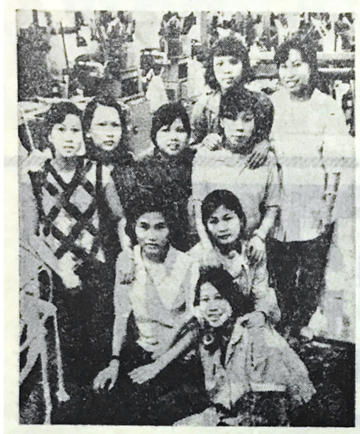
Вьетнамские работницы второго чулочного цеха, газета «Красное знамя», 27 декабря 1990, № 37 (4320), с. 2.