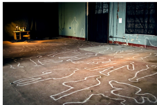
Работы на выставке «Силовое поле».