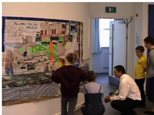
Воркшопы на Emplacements.