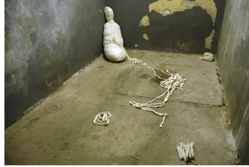
Евгений Антуфьев. «Без названия». 2009.