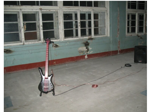
Работа Маркуса Хоффмана на выставке «Фрагменты неизвестного города».

Параллельно внутренним мероприятиям проводились и уличные — таким стал Graffiti (2011–2013 гг.), задействовавший большое количество как петербургских, так и иностранных художников. Для одной работы был задействован огромный фабричный забор, который нарекли Музеем Стрит-арта под открытым небом, а для другой , «Посвящение М. К. Эшеру», использовали фабричную дымовую трубу.