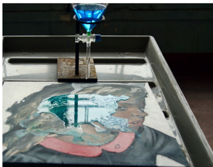
ставка «Силовое поле».