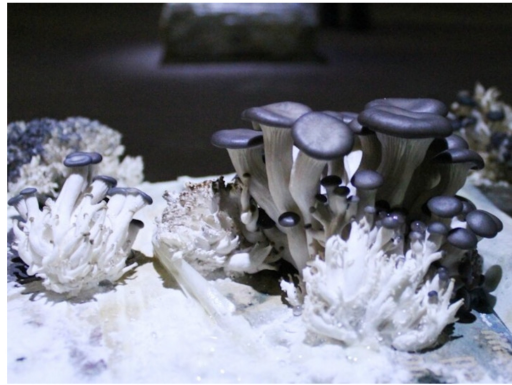
Фрагмент работы Маркуса Хоффмана на выставке «Фрагменты неизвестного города».