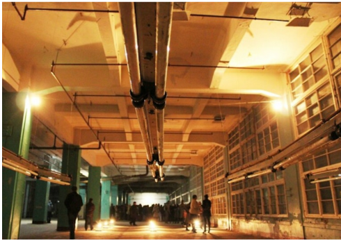
экспозиции «Фрагменты неизвестного города».

Кнехт задокументировал на видео, как он ломал привычные паттерны у местных водителей, таская лодку по дороге и паркуя ее на автостоянке перед фабрикой. Вот здесь можно прочитать про это больше.