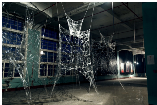
Работы на выставке «Силовое поле».