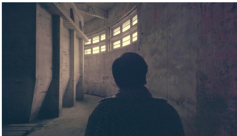
Скриншот из фильма «Очарование-93», 2020.

Весной 2020 мы пришли туда снимать фильм «Очарование-93», в котором бывшая работница возвращается на фабрику, чтобы проработать личную травму и встретиться со своими коллегами-призраками и вновь поговорить о том, как они — художники фабрики пытались наладить свое производство, как разрабатывали новые модели, как хотели открыть свой магазин, как верили или старались верить, но проиграли под натиском глобальных проблем. Для этого мы провели большое исследование ( тут и тут ), подняли архив фабричной газеты и выбрали оттуда несколько интервью работников вместе с их радостями, сомнениями и надеждами. Их речь вновь зазвучала на фабрике и сами они вернулись туда, правда уже в ином, хонтологическом обличье.